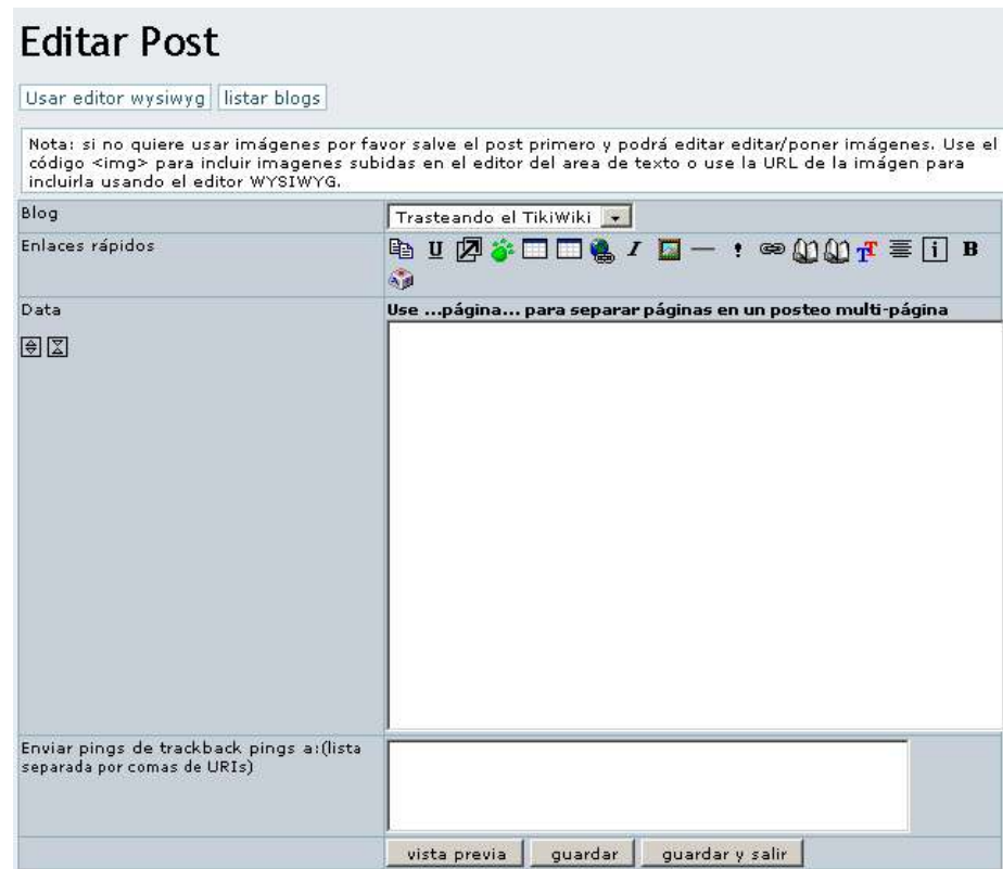
Editando nuevo registro