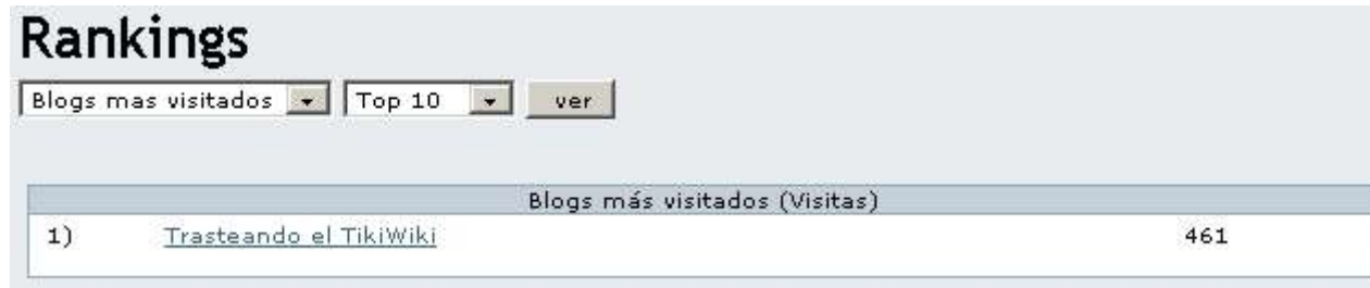
Ranking de blogs por número de visitas

Si tu Tikiwiki tiene muchos blogs, puede que quieras ver cuales son más populares que otros. Para hacer esto, haz click en Rankings (bajo blogs en Menu). Verás una lista jerarquizada o ranking , tal como se muestra en la siguiente imagen: