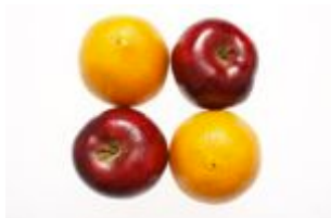
Apples and oranges