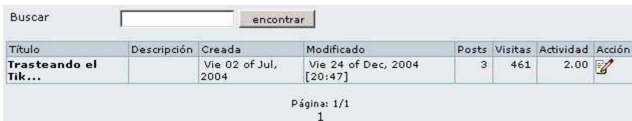
Lista de blogs disponibles

⚠ Si has creado un blog (y tu administrador de Tikiwiki te ha concedido los permisos apropiados), veras iconos que te permiten crear registros, editar la configuración, definir permisos dentro del blog, o incluso borrarlo completamente. La opción de borrado es peligrosa - se borrarán también todos los registros contenidos en el blog! No ejecutes esta opción a menos que estes